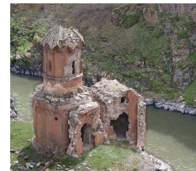
Ani, antica capitale del regno armeno, situata in territorio turco sulla gola del fiume Akhurian. Sito Unesco dal 2016