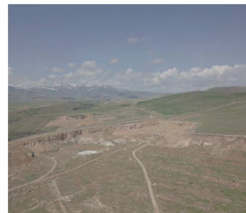
Veduta aerea del bacino di cava