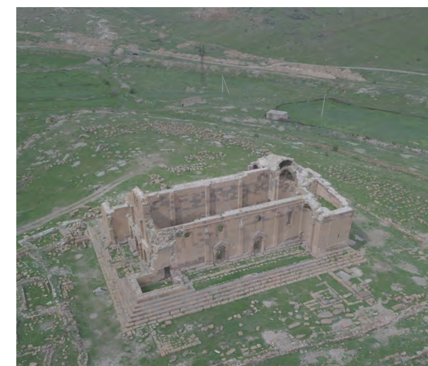
La basilica di Yereruik - tentative list Unesco dal 1995