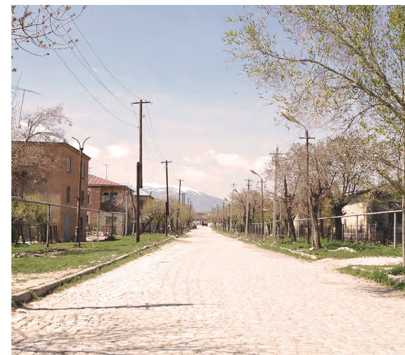
Veduta del viale principale del villaggio di Anipemza