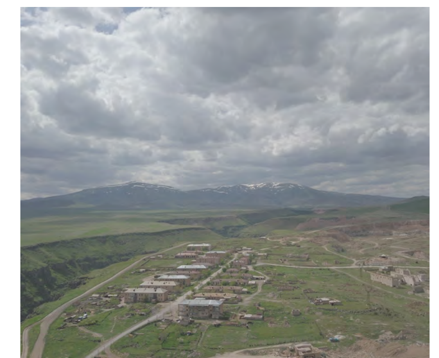
Veduta aerea del villaggio e della cava di Anipemza, a sinistra la gola del fiume Akhurian, confine tra Armenia e Turchia