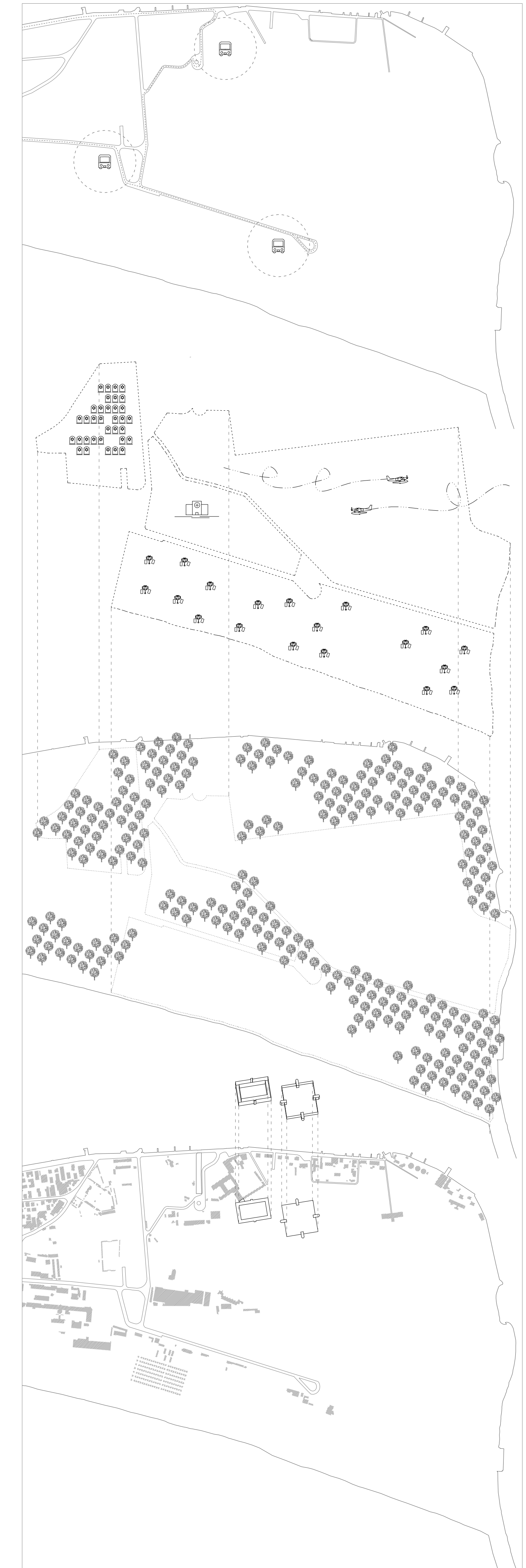
tavola IV | forte san nicolò, laguna di venezia analisi, keyplan, pianta delle fortificazioni veneziane, schemi: mobilità, vegetazione, ambiente costruito