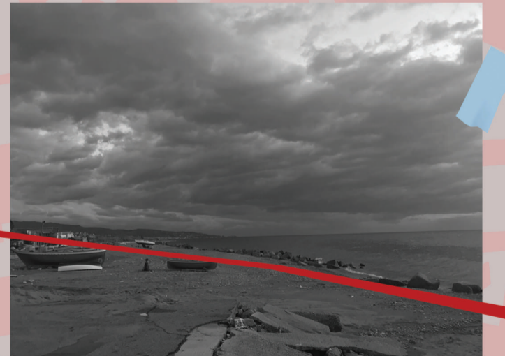
Margini - Spiaggia "La Sorgente"