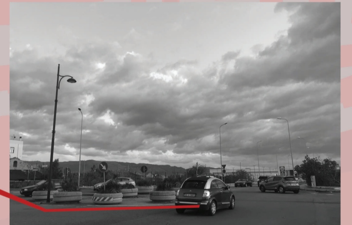
Nodi - viale Calabria