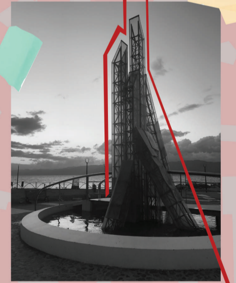
Riferimenti - Piazza Capannina