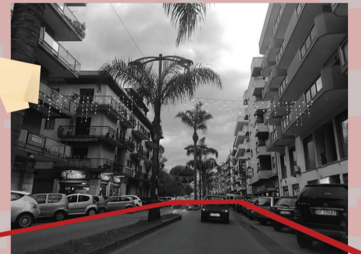
Percorsi - viale Aldo Moro