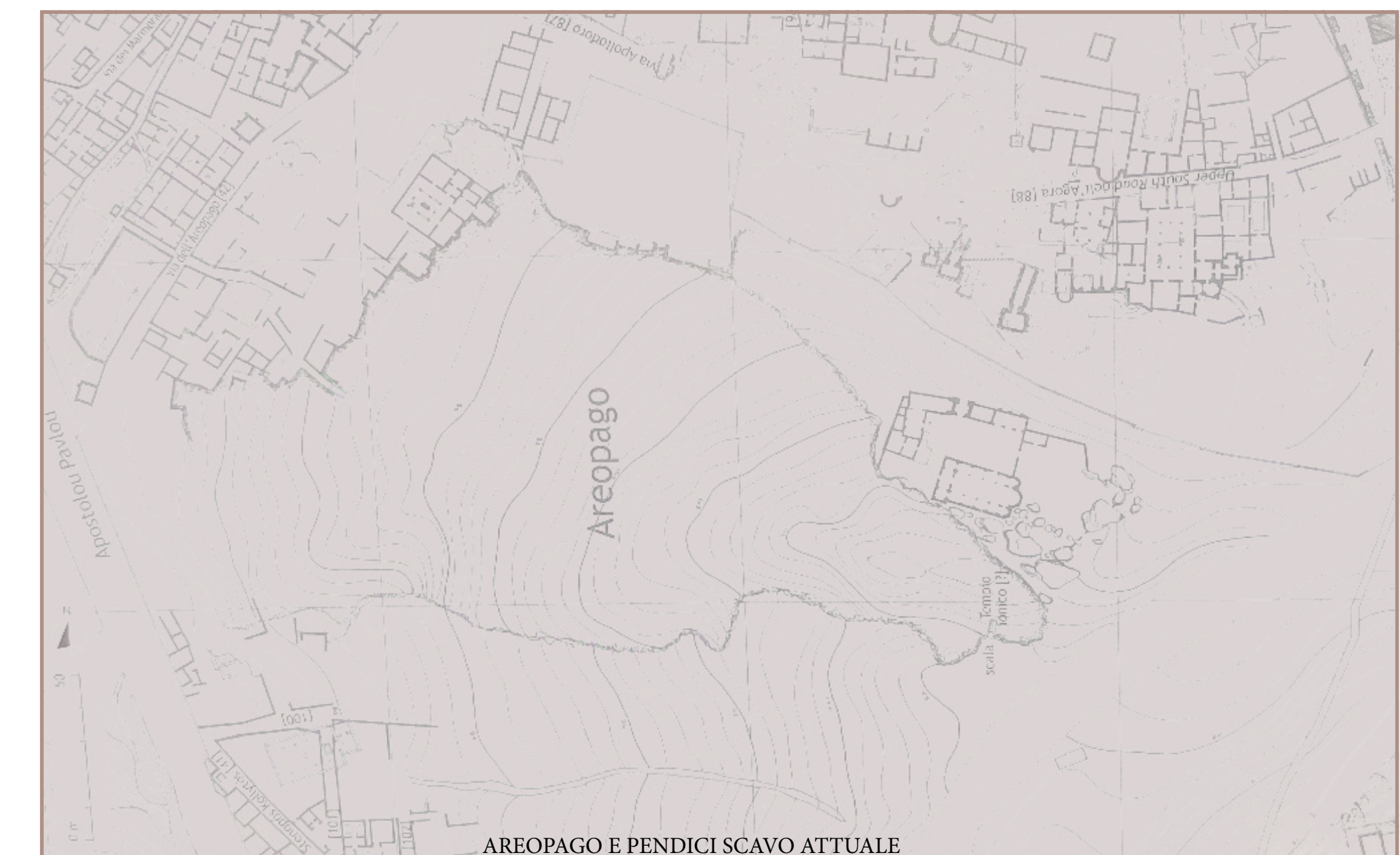
AREOPAGO E PENDICI SCAVO ATTUALE