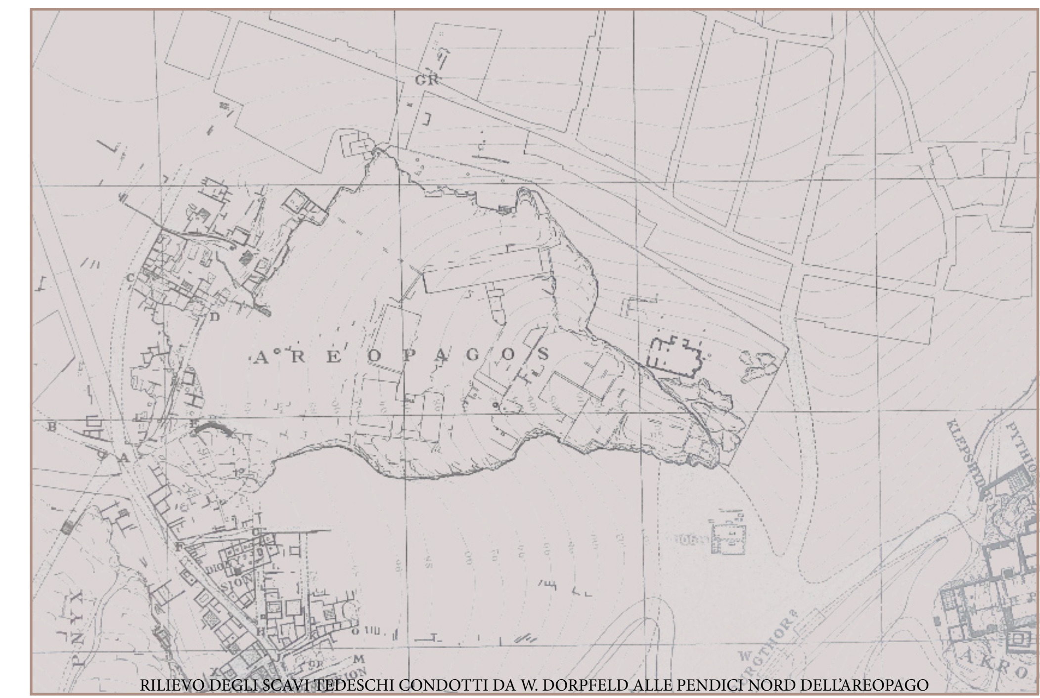
RILIEVO DEGLI SCAMI TEDESCHI CONDOTTI DA W. DORFFELD ALLE PENDICI NORD DELL'AREOPAGO