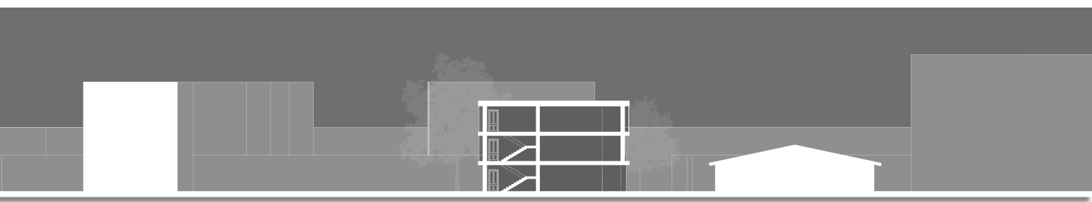
SEZIONE A - A'