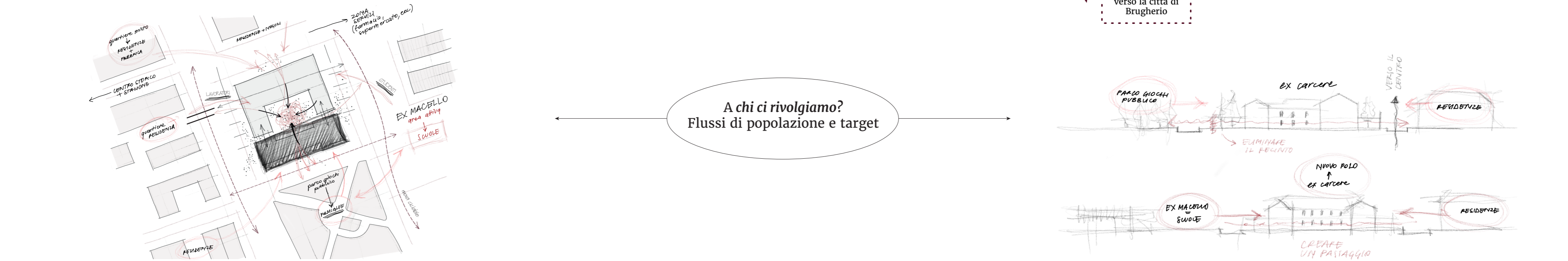
Flussi di popolazioni nei giorni feriali e festivi