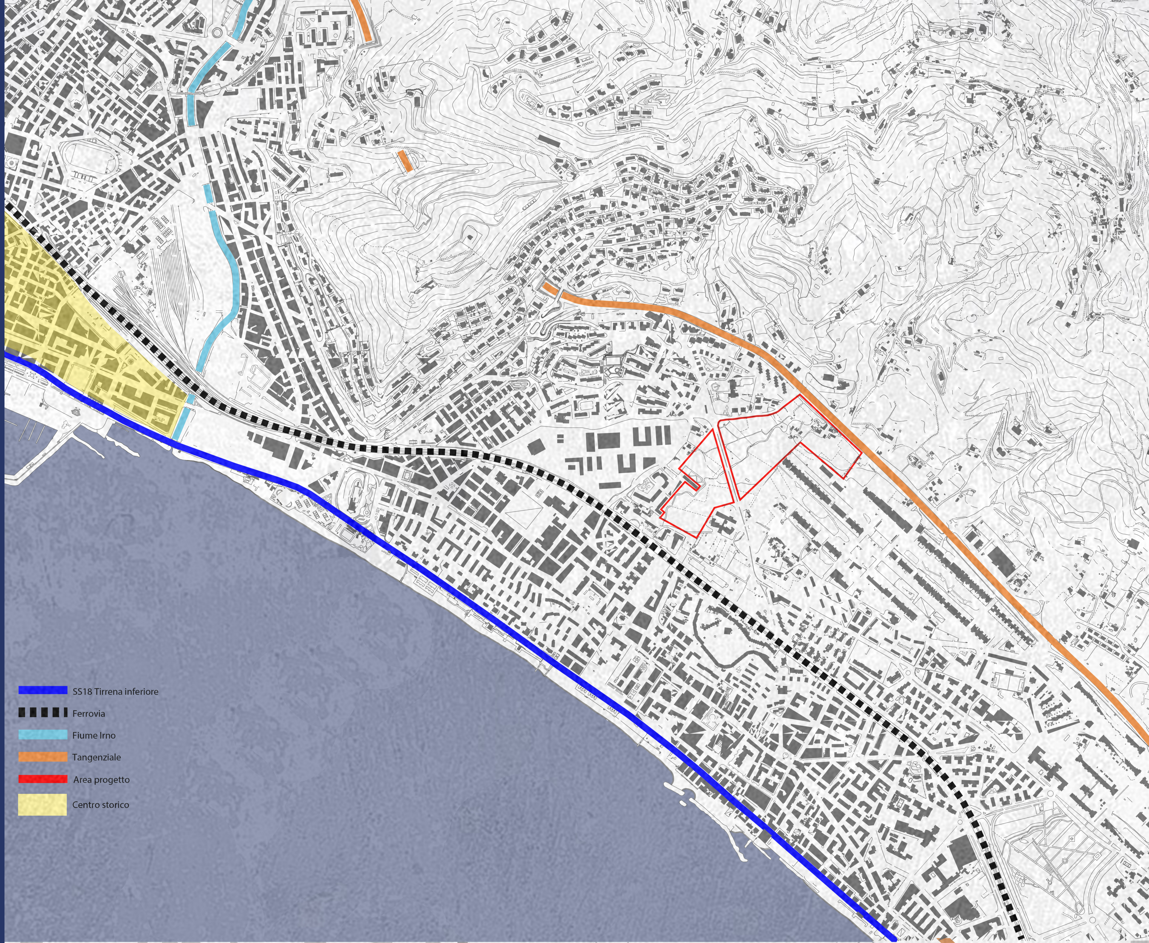
Diagramma area di progetto- Fuori scala

Analisi territoriale Salerno- Scala 1:5000