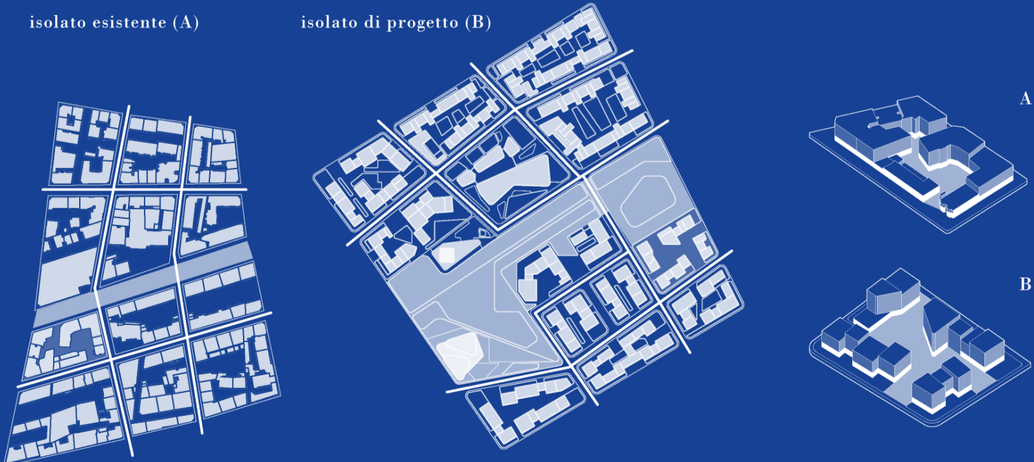
isolato di progetto (B)