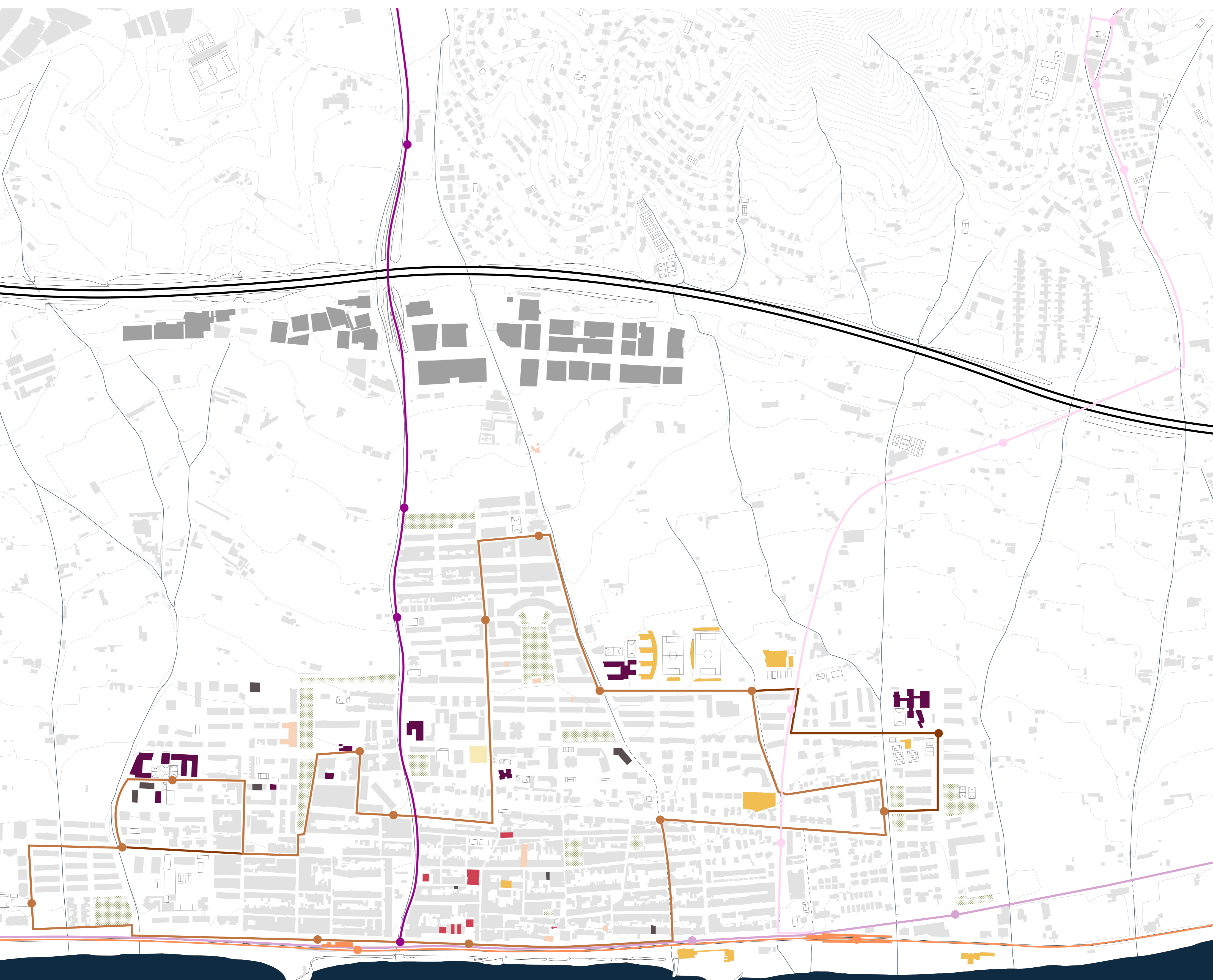
2. Copertura trasporto ferroviario Vilassar de Mar